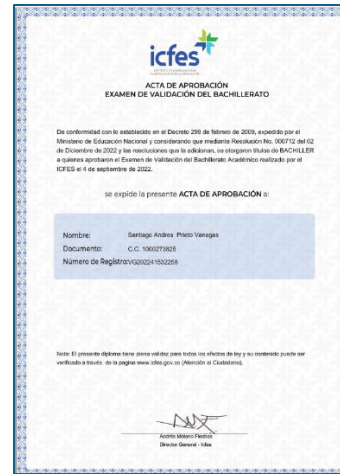
ACTA DE APROBACIÓN