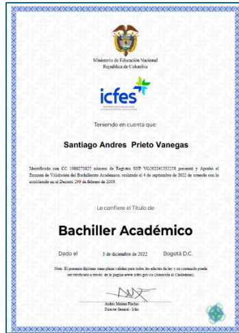
DIPLOMA DE BACHILLER ACADÉMICO